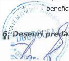
Tabel 6: Deșuri predate stației/stațiilor de sortare